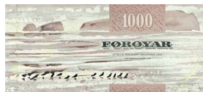
Format: 165x72 mm. Udsendt 15. september 2005.