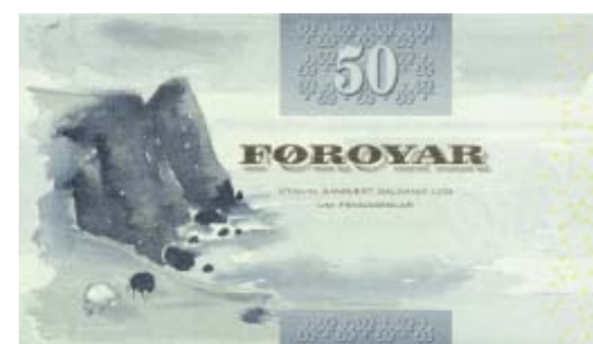
Format: 125x72 mm. Udsendt 3. juli 2001.