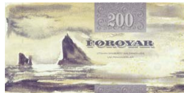
Format: 145x72 mm. Udsendt 19. januar 2004