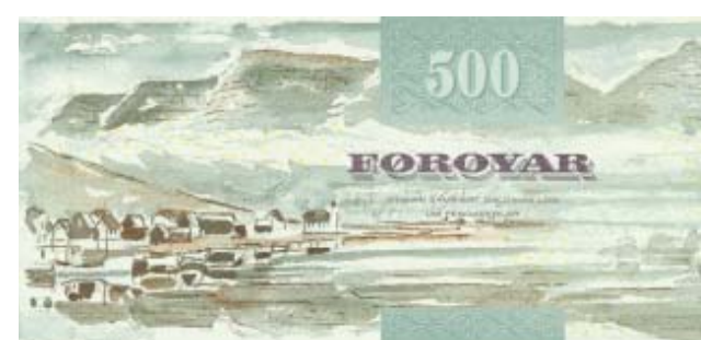
Format: 155x72 mm. Udsendt 30. november 2004.